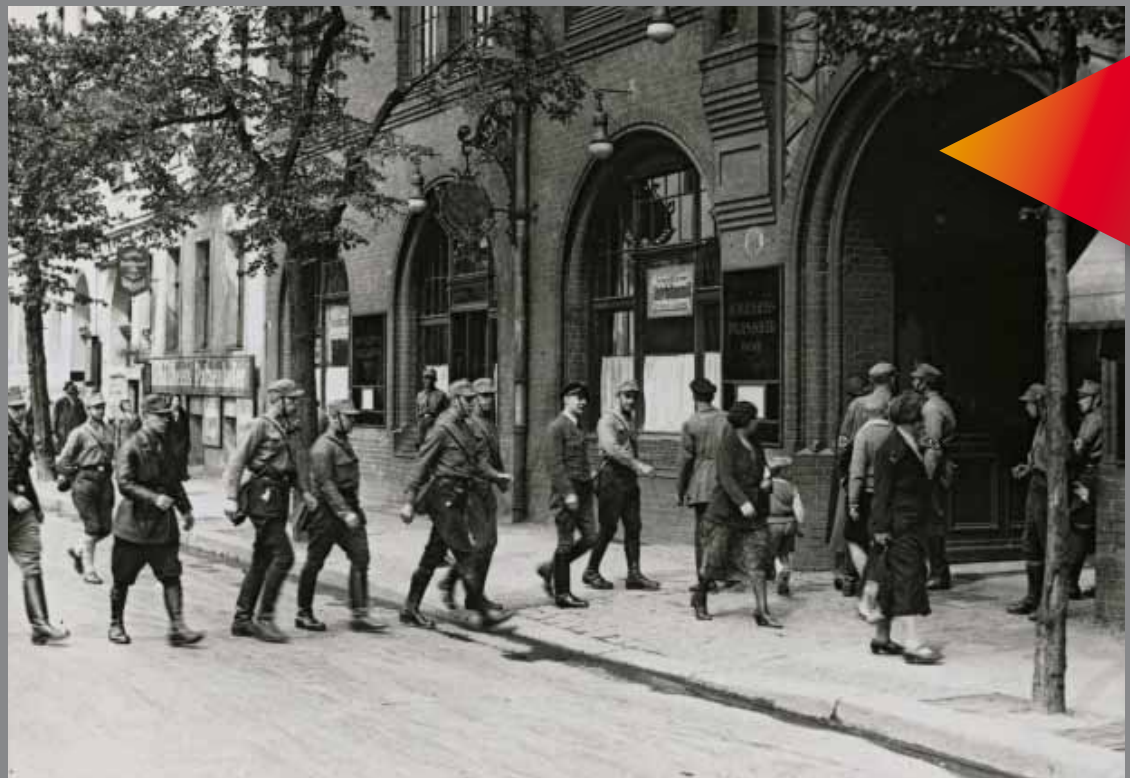
Erstürmung des Gewerkschaftsgebäudes am Berliner Engelufer durch SA und NSBO am 2. Mai 1933

GEWERKSCHAFTER IN KONZENTRATIONSLAGERN 1933 – 1945